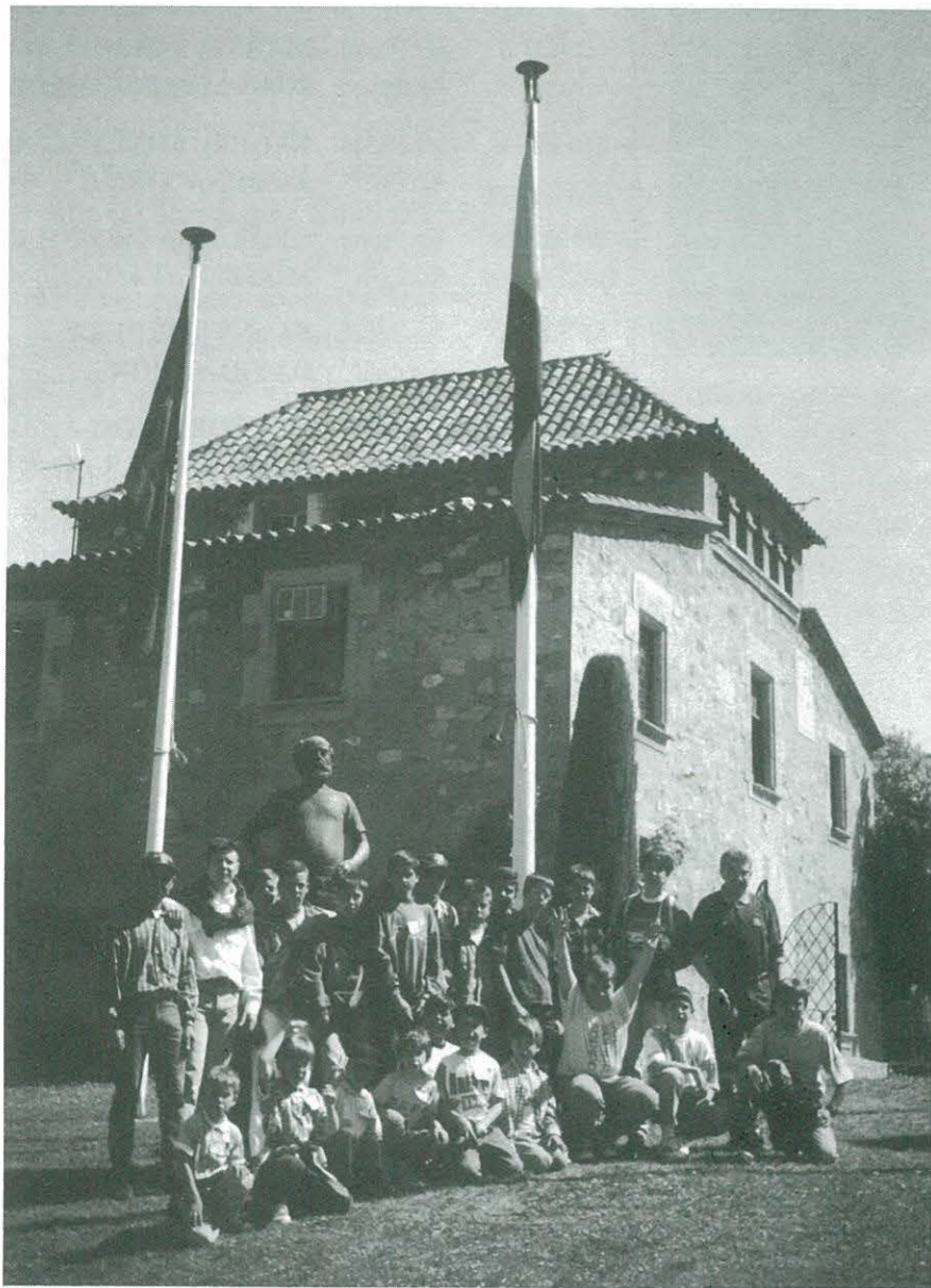
Els nens de l'escola de futbol de la Penya Barcelonista, de visita a "La Masia", del F.C. Barcelona

D'entrada, us he de dir, que en el meu escrit, no nombraré a cap persona ni Entitat. Això és així, perquè vull seguir una de les normes per les que sempre s'ha regit la Penya. SERIETAT i RESPECTE.